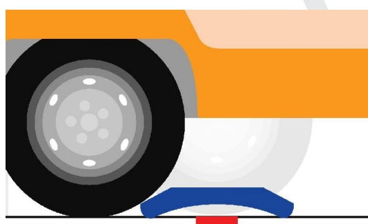
Fase di riposo: forma ad arco

Il prodotto a riposo si presenta con la caratteristica forma ad arco, in fase di utilizzo la culla di supporto si adatterà alla forma dello pneumatico.